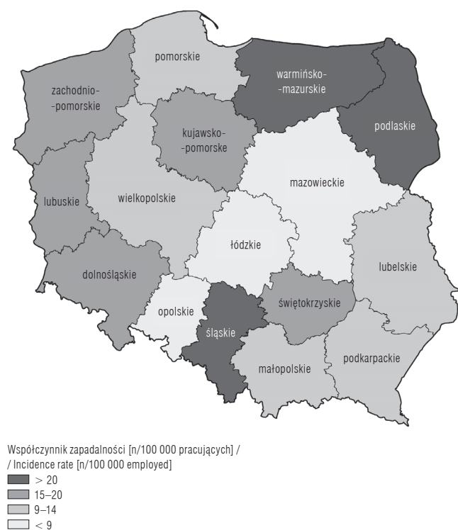
Rycina 3. Terytorialne zróźnicowanie zapadalności na choroby zawodowe w Polsce w 2016 r.

W 2016 r. najwyższy współczynnik zapadalności na choroby zawodowe na 100 tys. pracujących odnotowano w województwach: śląskim (40,8), warmińsko-mazurskim (27,9), podlaskim (21,3) i dolnośląskim (16,6). Najniższa zapadalność dotyczyła województw: łódzkiego (6,0), mazowieckiego (6,5), opolskiego (6,9), wielkopolskiego (9,4), podkarpackiego (9,5) i pomorskiego (9,6) (rycina 3).